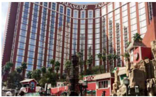
トレジャー・アイランドホテル

さてさて、長きにわたりアメリカのセキュリティ事情をお知らせしてきたが、ついに次号で最終回とさせていただきます。次回にはさらに、斬らせて頂く。